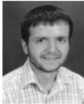
Ο Δημήτριος Ψάλτης

Επίκουρος Καθηγητής Τμήματος Φυσικής στο Πανεπιστήμιο της Arizona για τον τομέα των Θετικών Επιστημών (κλάδος Αστροφυσικής)