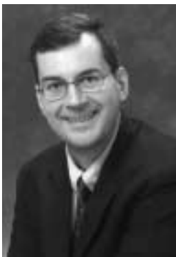
Ο Πασχάλης Αλεξανδρίδης

Καθηγητής Τμήματος Χημικής και Βιολογικής Μηχανικής στο Πανεπιστήμιο της Πολιτείας της Νέας Υόρκης στο Buffalo για τον τομέα των Εφαρμοσμένων Θετικών Επιστημών (κλάδος Μικρο- και Νανο- Επιστήμης και Τεχνολογίας)