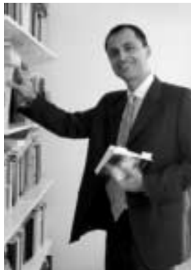
Ο Παύλος Ελευθεριάδης

Λέκτορας του Τμήματος Νομικής στο Πανεπιστήμιο της Οξφόρδης για τον τομέα των Κοινωνικών Επιστημών (κλάδος Επιστήμης του Δικαίου)