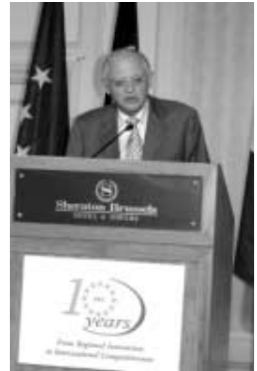
Ο Günter Verheugen στην εκδήλωση των IRCs.

Το Ελληνικό Κέντρο Αναδιανομής Καινοτομίας (IRC Hellenic) παρουσίασε μια εντυπωσιακή επίδοση κατά τη περίοδο 2000 - 2004 συμβάλλοντας στην επίτευξη περισσότερων από 30 συμφωνιών μεταφοράς τεχνολογίας. Επίσης, έχει εμπλακεί ενεργά στη διοργάνωση πολυάριθμων εκδηλώσεων μεταφοράς τεχνολογίας και έχει διαδραματίσει κεντρικό ρόλο στην ανάπτυξη των θεματικών ομάδων του Δικτύου των IRCs. Για αυτά τα επιτεύγματα έχει διακριθεί δύο φορές ως ένα από τα καλύτερα Ευρωπαϊκά Κέντρα Αναδιανομής Καινοτομίας. ■